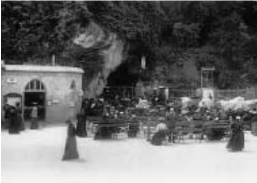
Grotte mit Bad um 1900.

che Botschaft, die sich treu an der Heiligen Schrift der Kirche orientiert. Alles verweist direkt auf Jesus Christus und seine Botschaft von Tod und Auferstehung. Er allein vermag den Menschen zur Freiheit der Kinder Gottes zu führen. Dafür hat er in Lourdes das Mädchen Bernadette auserwählt. Durch Maria erhielt sie, die Stadt Lourdes, ja die ganze Kirche Zeugnis von der Liebe Gottes. Sie macht die kleine Bernadette zu einer Verkünderin des Evangeliums, das sie im wahrsten Sinne des Wortes bis an die Enden der Welt trägt. Dabei