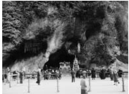
Grotte um 1960, Altar von 1907.

Exakt dieselben Zeichen (und einige darüber hinaus) begegnen uns auch in den Geheimnissen des Rosenkranzgebets. Wie wir von der ersten Erscheinung wissen,