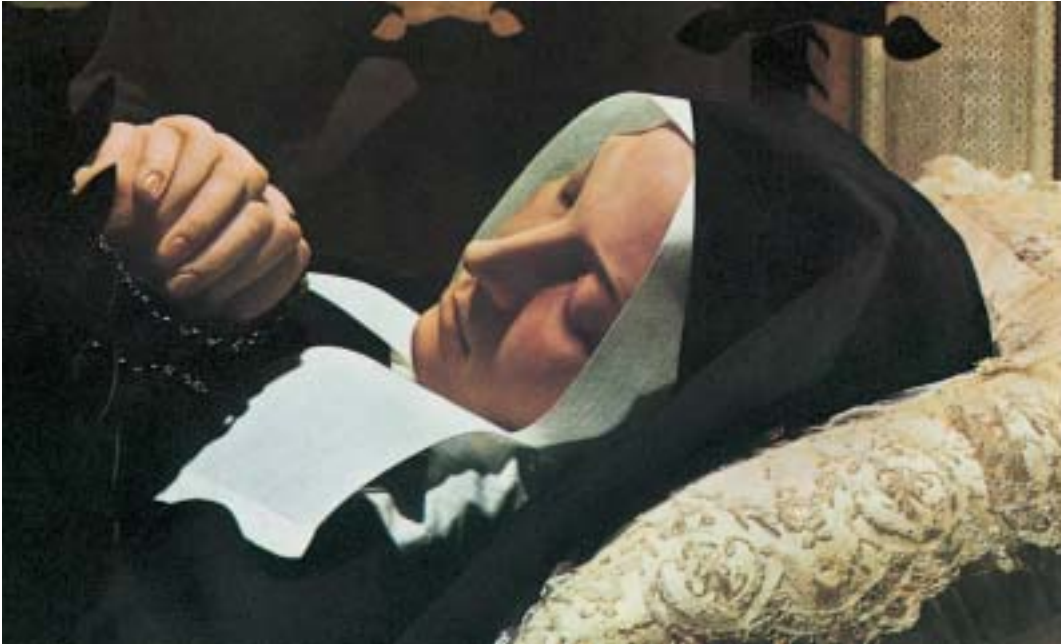
In Nevers ruht der unversehrte Leib der hl. Bernadette.