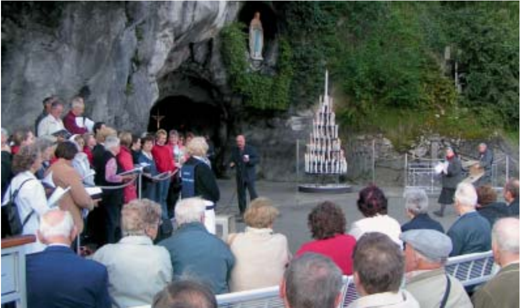
Unser Pilgerchor an der Grotte.