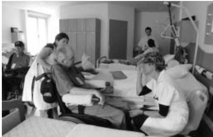
Den Kranken wird in Lourdes besondere Aufmerksamkeit geschenkt.

Herbstwallfahrt, Einsiedeln bei Sonnenschein erlebt: Samstag, 29. September 2007, haben Mitglieder des LPV Baden und Umgebung ihre Herbstwallfahrt durchgeführt. Mit zwei Cars wurden die Mitreisenden