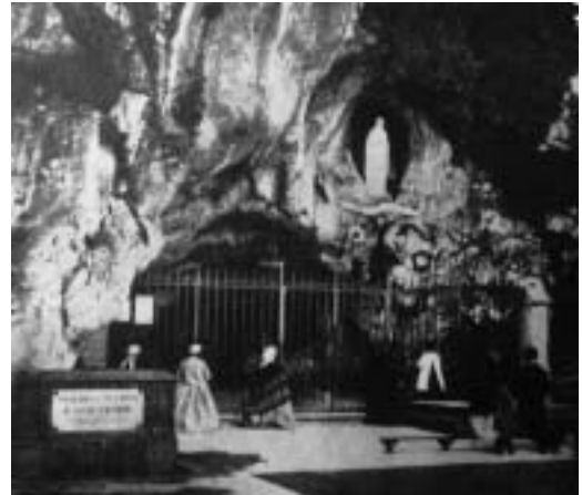
Grotte von Massabielle ca. 1880.

solle die Erscheinung nach ihrem Namen fragen. An der Grotte angekommen, betet die kleine Gruppe das Rosenkranzgebet. Während dem Gebet erscheint die schöne Dame. Bernadette schreit auf: «Sie kommt! Da ist sie!» Doch die andern können nichts sehen. Am Ende des Rosenkranzes streckt Bernadette der Erscheinung sichtbar eine Schreiftafel hin und fragt: «Madame, würden SIE bitte die Güte haben, ihren Namen schriftlich festzuhalten?». Diese lächelt und sagt: «Was ich IHNEN zu sagen habe, brauche ich nicht