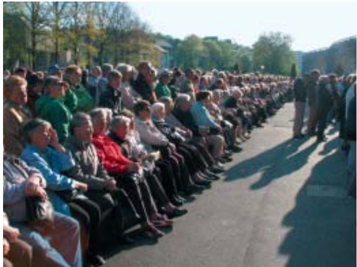
Eine lange Reihe von Pilgern hat sich an der Grotte versammelt. Sie wissen, die Gottesmutter hört auf ihre Bitten.

Sommerwallfahrt ins Urnerland: Am 26. Juni 2007 war es wieder soweit: 2 Cars der Firma Häfliger mit 64 Pilger/innen folgten der Einladung zu unserer traditionellen Sommerwallfahrt. Wiederum konnten wir