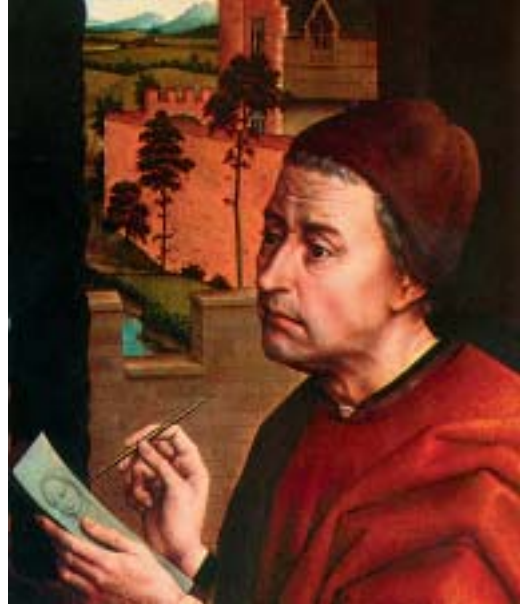
Lukas porträtiert die Gottesmutter.

Wer wissen möchte, in was marianische Frömmigkeit besteht oder wie ein Leben marianisch geprägt sein kann, muss auf die Evangelien zurückgreifen. Und da ist es vor allem der hl. Lukas, der uns Auskunft gibt. Mehr als doppelt so oft wie die anderen drei Evangelisten (wenn man die Apostelgeschichte dazu nimmt, die auch ihm zugeschrieben wird), nennt er die Mutter des Herrn mit dem Namen «Maria». Und weil er manche Episode aus ihrem Leben liebevoll ausmalt, hat die Tradition in ihm einen Maler vermutet und ihm mehrere hundert Marienbilder zugeschrieben. Man könnte sagen, Lukas leite die Marienverehrung ein, da er ihr die Worte in den Mund legt: «Siehe, von nun an werden mich selig preisen alle Geschlechter» (1,48).