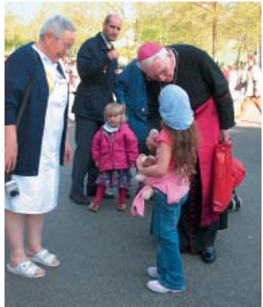
Bischof Amédée ging auf Gross und Klein zu, was geschätzt wurde.

Liebe Schwestern und Brüder, der Friede des Herrn begleite euch auf der Rückreise; wünscht ihn allen in der eigenen Familie, Pfarrei und Gemeinschaft. Und wenn man euch fragt: «Warum bist du so froh und vertrauensvoll?», so sage einfach: «Ich habe mich versöhnen lassen und stelle mein Leben in den Dienst der Liebe. Amen.»