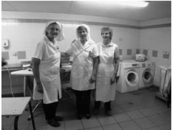
Viel Arbeit wird unbemerkt für die Wallfahrer hinter den Kulissen verrichtet; so haben die Wäscherinnen buchstäblich alle Hände voll zu tun.

der Deutschen und Rätoromanischen Schweiz, erklärte kurz den Aufbau und die Organisation der Wallfahrt. Sie zeigte besonders die Probleme auf, die bei der Organisation entstünden, nicht zuletzt die finanziellen Schwierigkeiten, welche die Wallfahrt immer stärker belasten. Man habe daher beschlossen, die verschiedenen Lour-