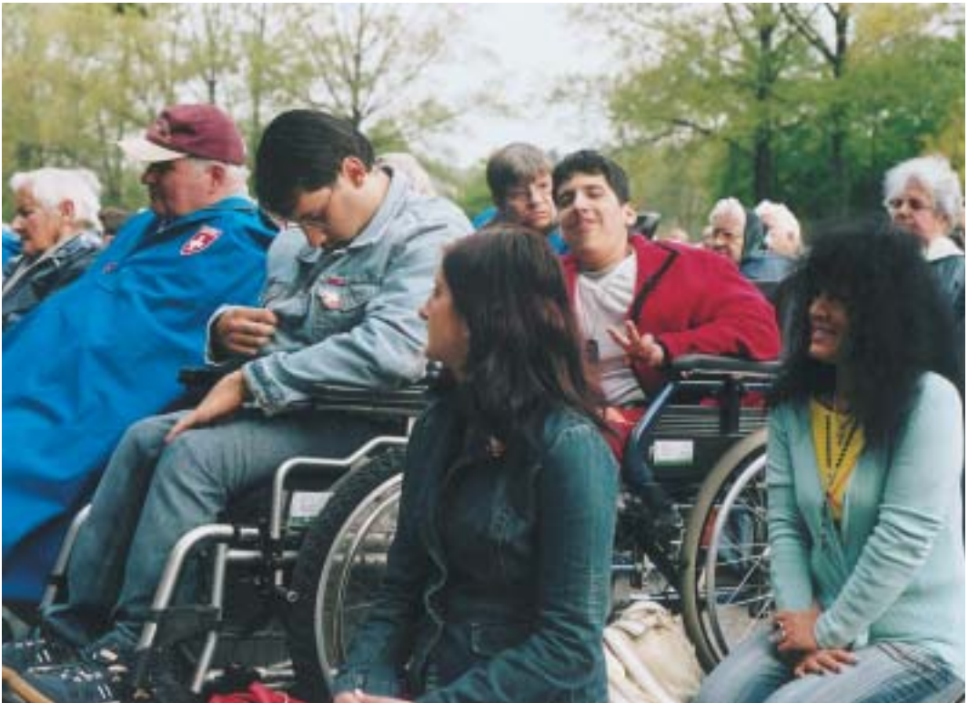
Kranke und Behinderte sind in Lourdes liebevoll umsorgt, sodass sie sich wohl fühlen.