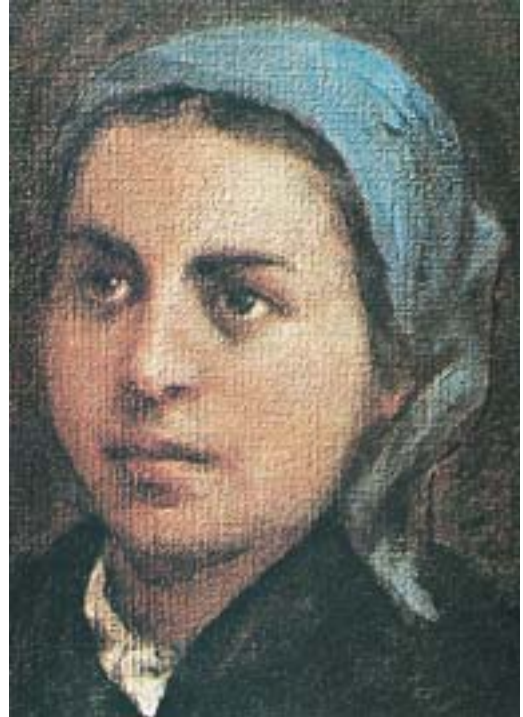
Bernadette Soubirous (1844–1879).

schon früh lernte Bernadette den Rosenkranz beten. Bei den Erscheinungen nahm sie ihn jeweils zur Hand. In diesem Gebet konnte sie nicht nur das Leben Mariens sondern vor allem die grossen Geheimnisse Jesu Christi von seiner Geburt bis zur Auferstehung betrachten. Sie bekannte: «Ich erwäge, dass die allerseligste Jungfrau