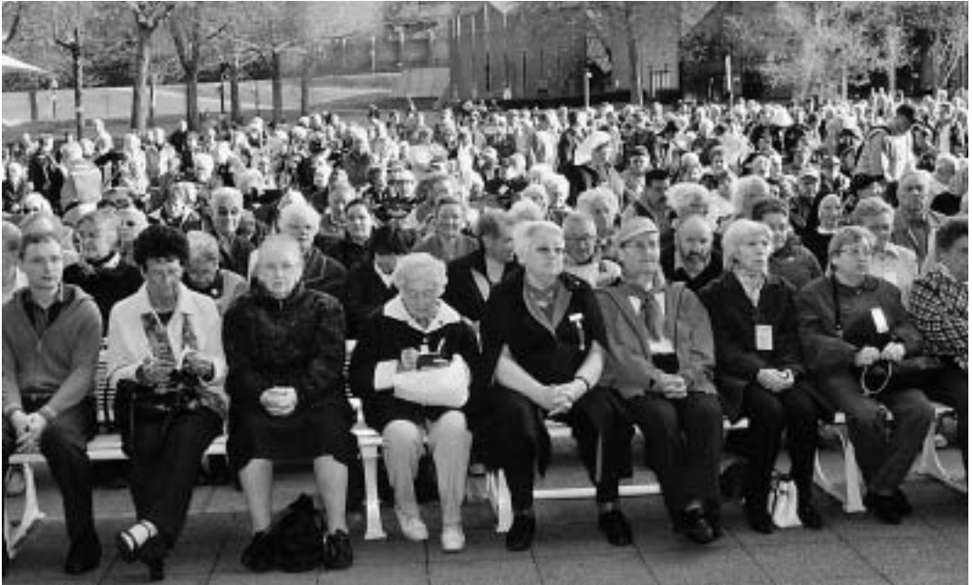
Kranke und Behinderte freuen sich immer am meisten auf den Gottesdienst an der Grotte. Leider ist er einer grösseren Gruppe jeweils nur einmal möglich.

ihre einzelnen Glieder und ihre Einrichtungen steht sie auch weiterhin den Leidenden und Sterbenden bei und versucht, deren Würde in diesen entscheidenden Stunden des menschlichen Daseins zu erhalten. Viele dieser Personen – das im Gesundheitswesen tätige Personal, die Seelsorger, die freiwilligen Helfer – und Einrichtungen in aller Welt dienen den Kranken unermüdlich in den Krankenhäusern und Einrichtungen für Palliativpflege, auf den Strassen der Städte, im Rahmen von Projekten zur häuslichen Pflege und in den Pfarreien.