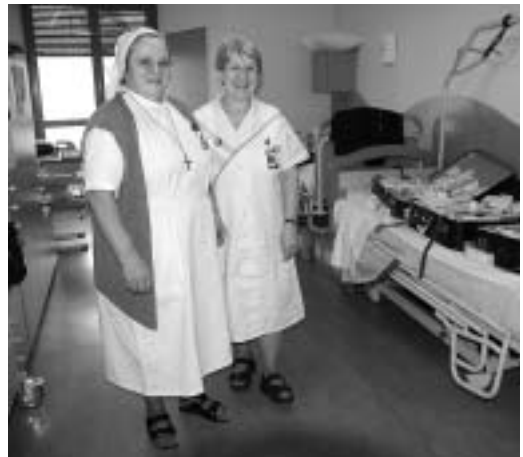
Sr. Cäcilia ist zuständig für den pflegerischen Dienst, aber auch für die notwendigen Medikamente.