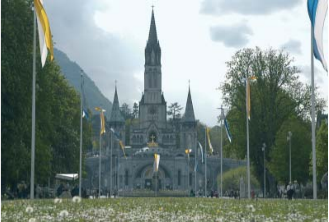
Dieses Jahr zeigte sich Lourdes ganz von der sonnigen Seite.

gerkuren hin und her. Beachten Sie z.B. wo Ihnen heute der Begriff «Sünde» am meisten begegnet? Meistens im Zusammenhang mit Ess- oder Diätfehlern, Süßigkeiten, üppigen Mahlzeiten: «Ich habe heute wieder etwas gesündigt.» Dynamisch sein ist in. Der Arbeitstag ist vollgepackt mit Terminen, Sitzungen, Besprechungen etc. Wenn dann der erschöpfende Arbeitstag zu Ende ist, geht es weiter, dann kommen Partys, Tennis, Squash, Restaurants, Bars, Kino, Theater etc., etc. Es muss doch etwas laufen.