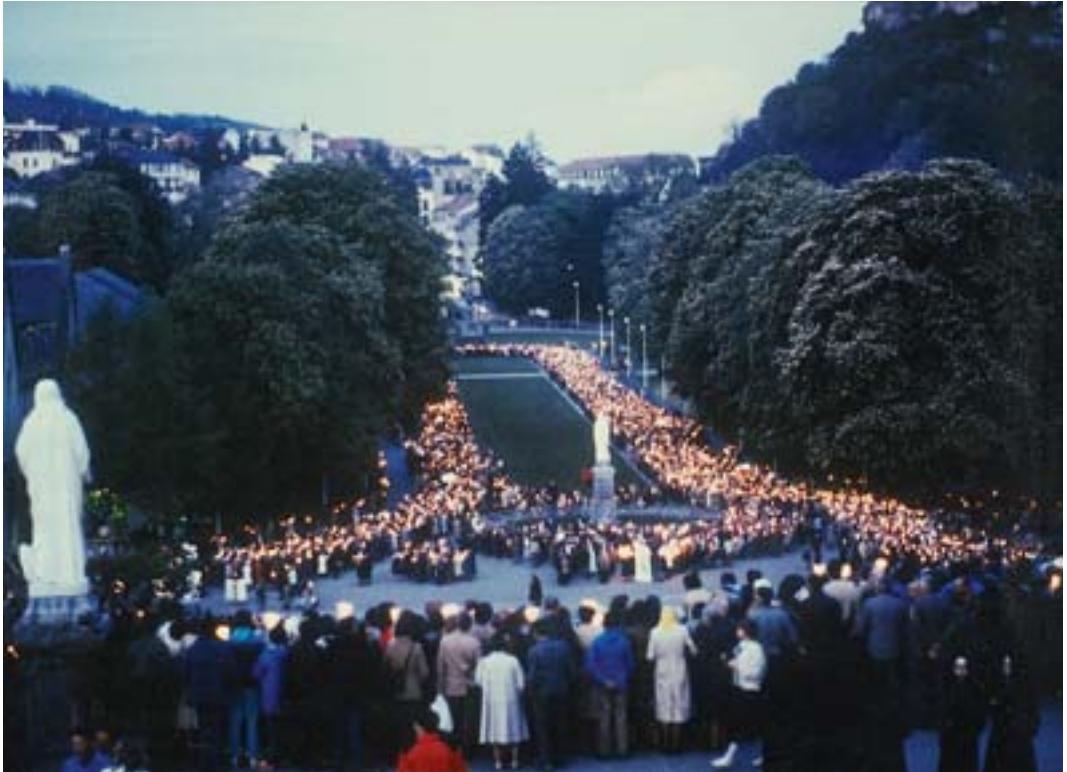
Bereits am ersten Abend in Lourdes nahm Papst Benedikt XVI. an der Lichterprozession teil.

selbst Kerzen an diesen Ort des Lichtes und des Friedens. Die Muttergottes tat selber kund, dass ihr diese berührende Huldigung dieser tausenden Kerzen gefiel, die seitdem zu ihrer Ehre ununterbrochen den Felsen der Erscheinung erleuchten. Von jenem Tag an glüht vor der Grotte Tag und Nacht, im Sommer wie im Winter, ein brennender Dornbusch, entzündet vom Gebet der Pilger und der Kranken, die ihre Sorgen und Nöte, vor allem aber ihren Glauben und ihre Hoffnung zum Ausdruck bringen.