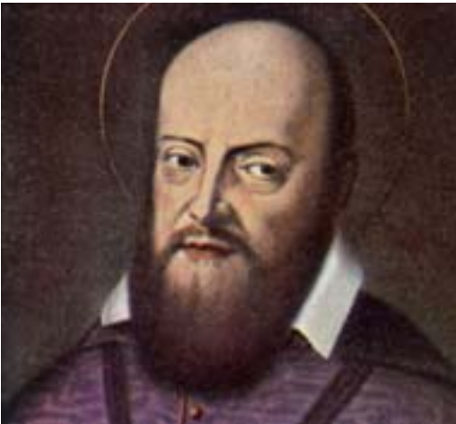
Franz von Sales, Bischof von Genf.

annehmen. Doch das gestattete der Erzbischof von Lyon nicht. Durch Briefe (rund 2000 sind erhalten) und Bücher leitete er viele zu einem innerlichen Leben an. Zahlreiche Auflagen erlebten bis heute «Philothea» und «Timotheus», in denen er ausführt, wie sich persönliche Frömmigkeit und Erfüllung der Berufspflichten verbinden lassen. Etwas von seiner Ausstrahlung beweist ein Wort des hl. Vinzenz von Paul: