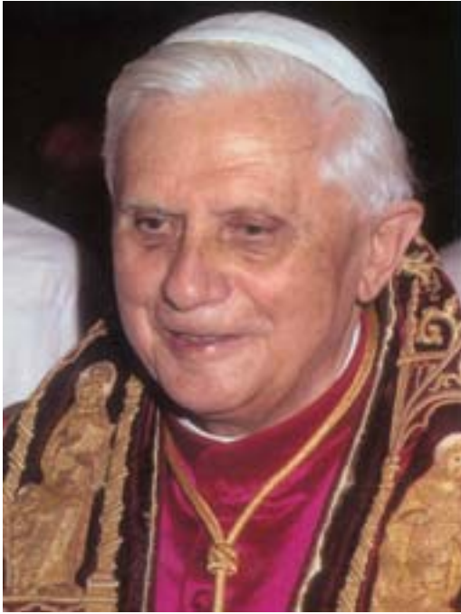
Papst Benedikt XVI.

hierher zu kommen?» fragt die Dame sie. «Sie schaute mich an wie ein Mensch, der mit einem anderen Menschen spricht.» In dieser Unterhaltung, in diesem ganz von Feingefühl geprägten Dialog beauftragt die Dame sie, einige ganz einfache Botschaften über das Gebet, die Busse und die Umkehr zu vermitteln. Dass Maria schön ist, überrascht nicht, offenbart sie doch in der Erscheinung vom 25. März 1858 ihren Namen so: «Ich bin die Unbefleckte Empfängnis».