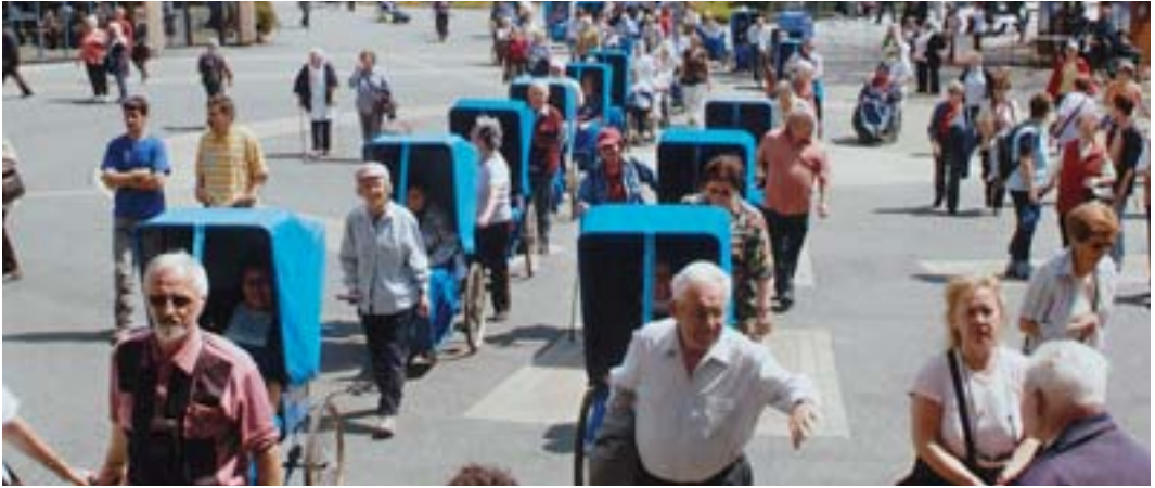
Das Besondere von Lourdes ist die Sorge um die Kranken.

Welt» ist das Thema des Eucharistischen Kongresses. Es hebt hervor, dass die Eucharistie das Geschenk ist, das der Vater der Welt macht, seinen eingeborenen, menschengewordenen und gekreuzigten Sohn. Er ist es, der uns um den eucharistischen Tisch versammelt und der in seinen Jüngern liebevolle Fürsorge weckt für die Leidenden und Kranken, in denen die christliche Gemeinschaft das Antlitz ihres Herrn erkennt. Wie ich im Apostolischen Schreiben Sacramentum caritatis betont habe, «müssen unsere Gemeinden, wenn sie Eucharistie feiern, sich immer bewusster werden, dass das Opfer Christi für alle ist und die Eucharistie darum jeden Christgläubigen drängt, selbst «gebrochenes Brot» für die anderen zu werden» (Nr. 88). So werden wir ermutigt, uns persönlich dafür einzusetzen, den Geschwistern zu dienen, besonders denen in Not, denn es ist wirklich die Berufung eines jeden Christen, zusammen mit Christus gebrochenes Brot für das Leben der Welt zu sein.