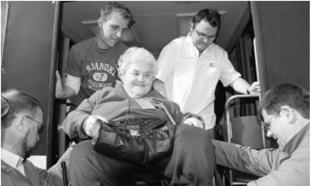
Mit Freude fahren die Kranken nach Lourdes, in der Freude neu gestärkt kehren sie in den Alltag zurück.

ben versprochen? Freuen wir uns über diesen Glauben, der uns in der Taufe geschenkt und hier im gemeinsamen Beten gestärkt wurde, über einen Glauben, der unserem Leben Sinn gibt.