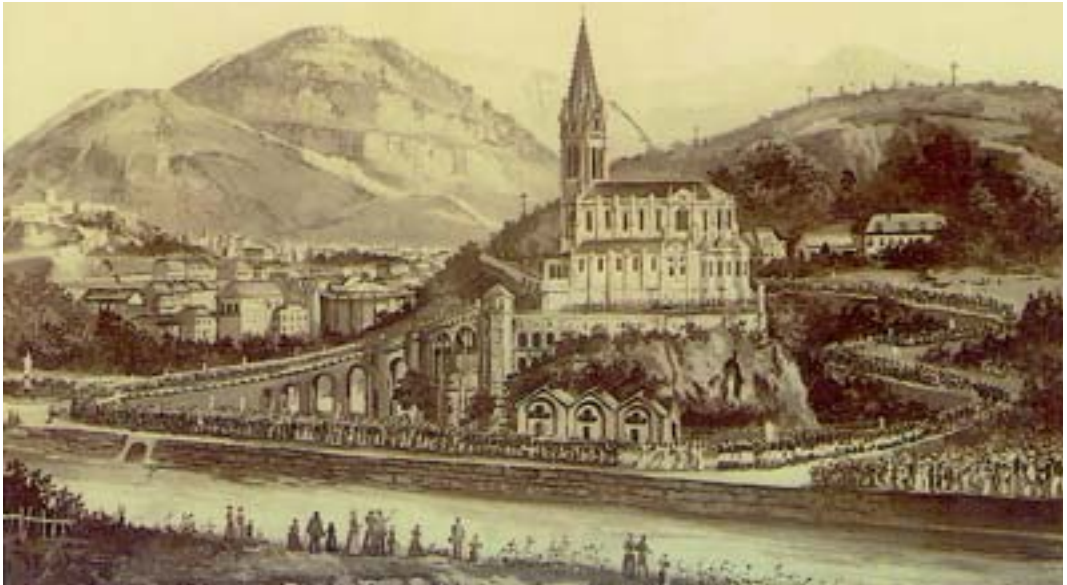
Ein Blick von der Prärie auf eine Sakramentsprozession im 19. Jahrhundert. Der Gave wurde noch mehr zurückgedrängt, um Raum für den Platz zu gewinnen.

DAS LICHT». In Prozession ziehen wir in die dunklen Kirchen unserer Pfarreien und erleuchten den Kirchenraum mit dem Licht Christi. So wie dieses Licht den dunklen Raum erhellt, will er auch unser Herz erleuchten, damit wir ihm begegnen wie die Frauen am leeren Grab, wie die Emmausjünger mit den brennenden Herzen und wie die Zwölf, die das Licht bis an die Enden der Welt bringen. Dafür ist die Botschaft von Lourdes mit dem Kind Bernadette ein wirklich leuchtendes Zeichen. Nichts mehr steht im Mittelpunkt als Jesus