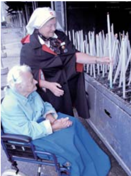
Eine Helferin entzündet ein Licht der Hoffnung und der Freude.