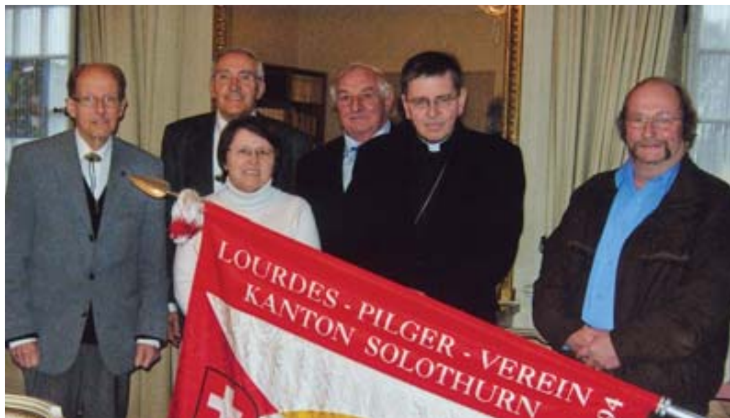
Zur Überreichung der Urkunde wurde eine Delegation des Vorstandes von Bischof Kurt Koch im Bischofshaus empfangen.