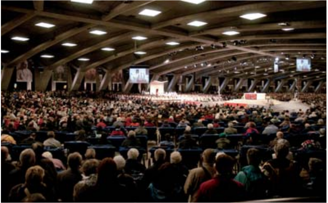
Mit 25'000 anderen PilgerInnen feierten wir den Internationalen Gottesdienst in der Piusbasilika.