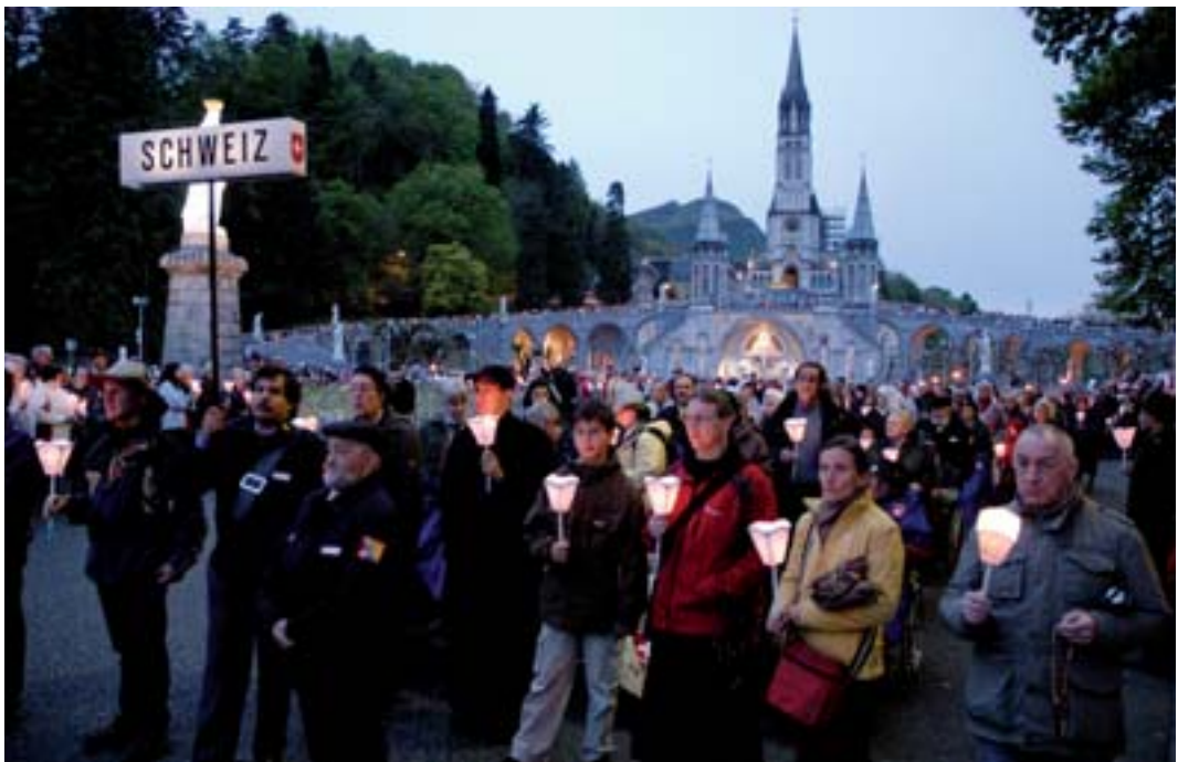
Die Schweizer Pilgerfamilie bei der abendlichen Lichterprozession – auch sie ist ein Weg des Lebens.