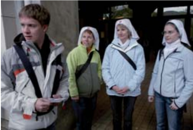
Viele der HelferInnen finden sich jedes Jahr zu einem Dienst in Lourdes ein.