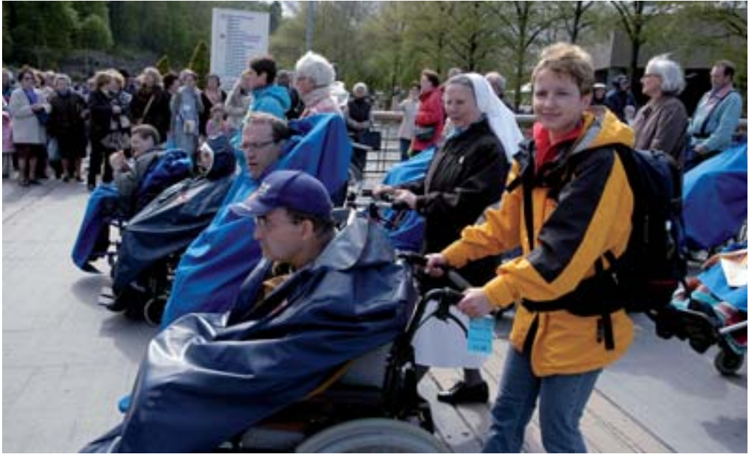
Auch während der Sakramentsprozession schieben Freiwillige die Rollstühle der Behinderten und Kranken.