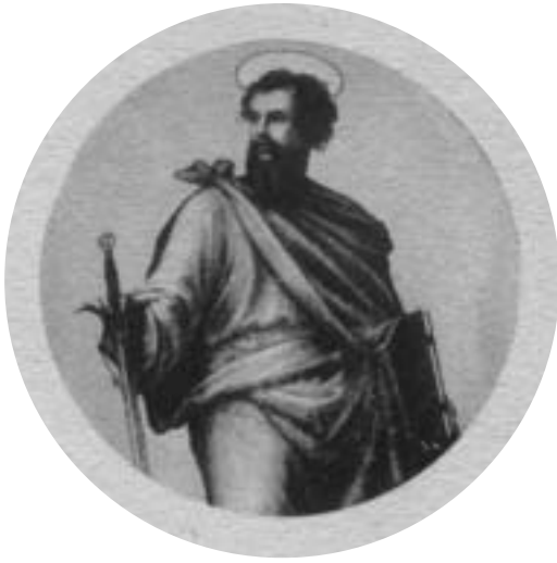
Der Völkerapostel Paulus wurde als römischer Bürger mit dem Schwert hingerichtet.

er die Grösse Christi, des Erlösers, besungen, das Hohelied der Liebe und den Lobpreis der Gnade angestimmt. Seiner soll nun ein Jahr lang gedacht werden. Am 29. Juni eröffnet der Papst das Paulusjahr in der Basilika St. Paul vor den Mauern, das bis zum 29. Juni 2009 dauern wird. Es sind dort in der Kirche und in der Benediktinerabtei liturgische, kulturelle und ökumenische Veranstaltungen und Konferenzen vorgesehen. Unter dem Hauptaltar befindet sich ein Sarkophag von 390 n. Ch., der 2005 wieder entdeckt wurde. Man nimmt an, dass darin die Gebeine des Völkerapostels ruhen. Der Papst gab nun die Erlaubnis, mit einem Endoskop das Innere des Steinsarges sichtbar zu machen. In Tarsos selbst eröffnet Kardinal Walter Kasper ebenfalls am 29. Juni das Paulusjahr. Bischof Luigi Padovese lädt die Christen zu einer Wallfahrt an den Geburtsort des Heiligen ein.