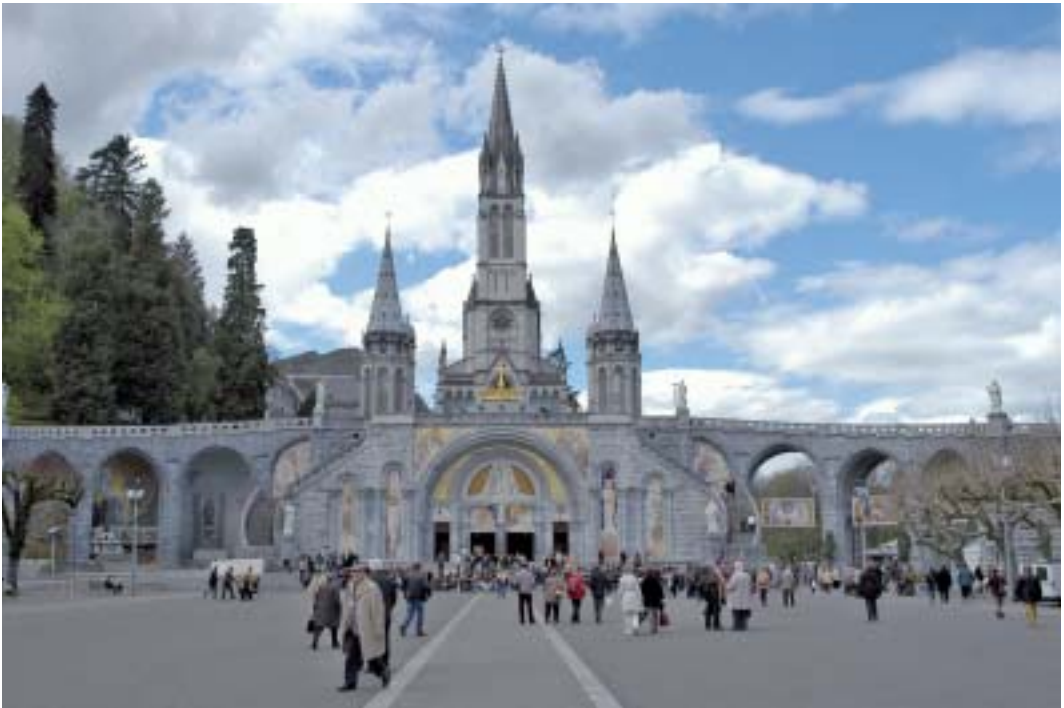
Gleich nach der Ankunft in Lourdes strömten viele Pilger zur Rosenkranzbasilika und zur Grotte hinunter.

se, das durch Maria geschah und geschieht, auch an uns geschehen kann. Darin geschieht Vereinigung mit Gott. Und Maria führt uns zu dieser Vereinigung. Das hat sie an Bernadette gezeigt, das tat sie an den Aposteln und das lehrt sie auch uns, wenn sie uns den Weg zu unseren Nächsten zeigt. Denn die Vereinigung in Gott hat immer ganz konkrete Auswirkungen. Auch diese zweite Dimension der Vereinigung begegnete uns in Lourdes auf Schritt und Tritt. Was machen denn die vielen freiwilligen Helfer und Helferinnen anderes, als von ihrer Vereinigung in Christus Zeugnis zu geben, indem sie den kranken und bedürftigen Pilgern zu Hilfe kommen? Ja, hier erfüllt sich der Auftrag Jesu Christi: Geht hinaus in alle Welt und verkündet das Evangelium allen Völkern. Hierin steckt die