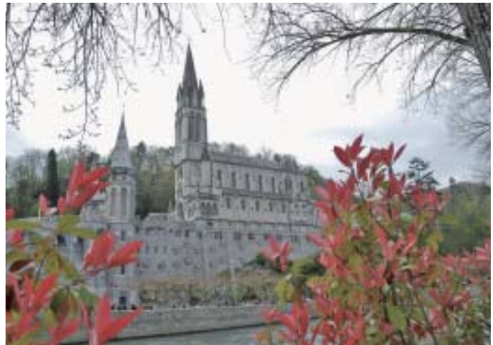
Über dem Felsen der Erscheinungsgrotte wurde die Basilika der Unbefleckten Empfängnis gebaut.