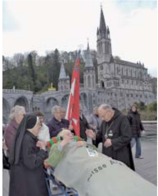
Abt Ivo spendet einer Kranken den Segen.