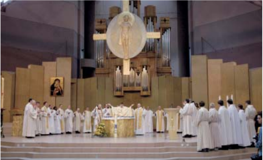
Den Segen über das Öl zur Krankensalbung am Dienstag erleben die Priester mit erhobenen Händen.