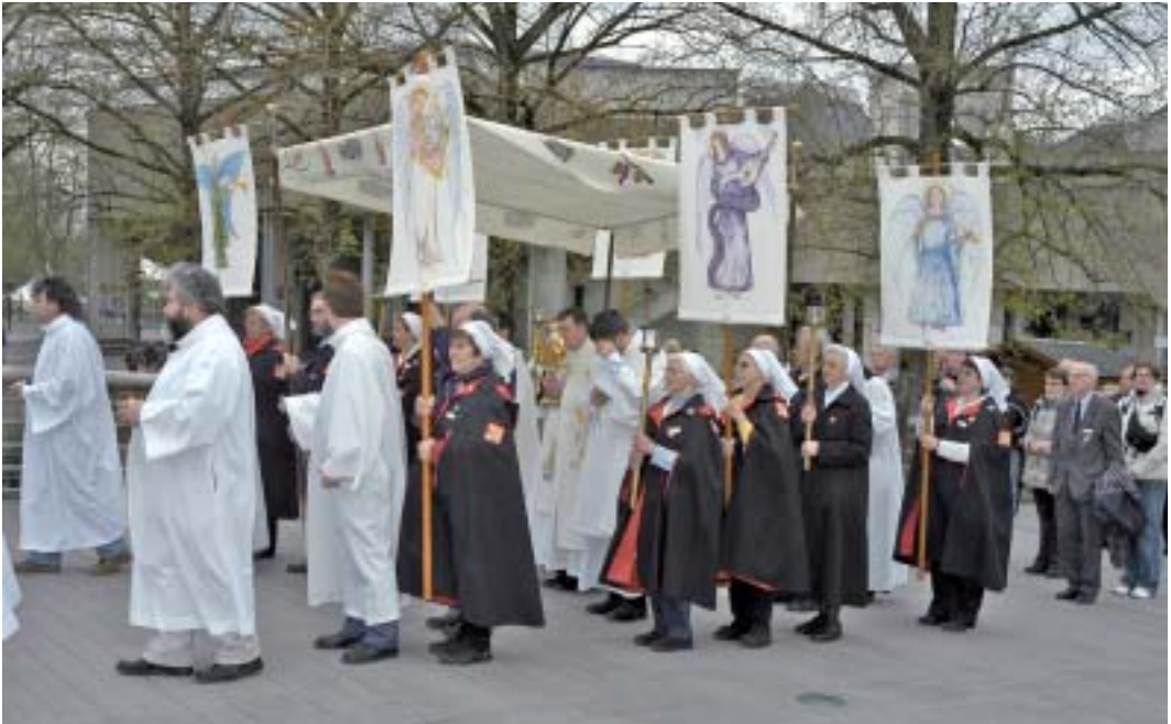
Freudig beteiligten sich die Schweizer am Montag an der Sakramentsprozession; Bischof Kurt Koch trug das Allerheiligste.