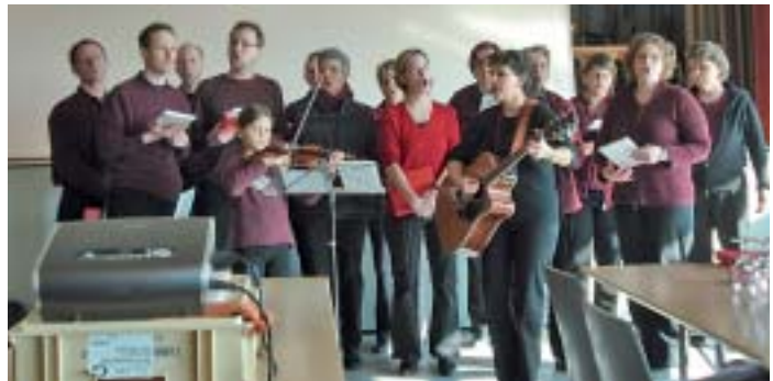
Das Lourdes-Chörli erfreute die Festgemeinde des Lourdespilgervereins Maria Bildstein mit Darbietungen.

Einladung zur Vereinswallfahrt 2008 am Sonntag, dem 15. Juni (Datum der Vereinsgründung!):