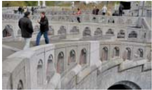
Ein Vexierbild: die Brüstungen der beiden Rampen und des Platzes vor der Krypta.

Erfolg kann deshalb auch nicht einfach das Gütezeichen von uns Christen und der Kir-