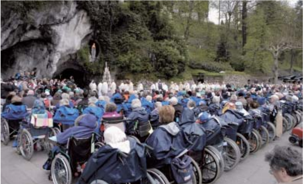
Am Montag feierten Gesunde und Kranke die Eucharistie an der Grotte, wo Maria vor 150 Jahren erschienen ist.