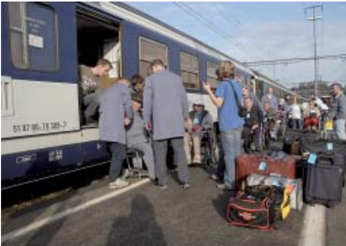
Kranke werden mit allem Gepäck in den Sanitätswagen untergebracht.