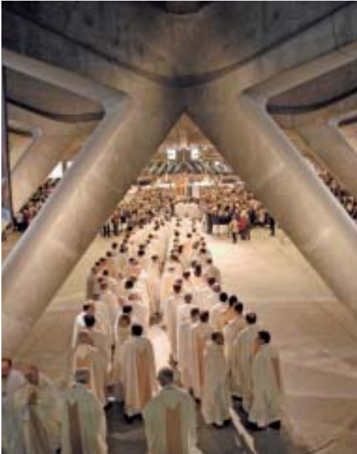
In einer langen Reihe zogen die Priester am Mittwoch zur Eucharistiefeier in die Piusbasilika.