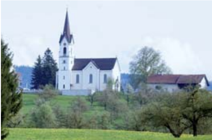
Wallfahrtskirche Maria Königin, St. Pelagiberg.

ses einige Stationen unserer Himmelskönigin auf. Auf die Botschaft des Engels antwortete Maria mit den Worten: «Siehe, ich bin die Magd des Herrn.» Sur Peter lud uns ein, auch unser geistliches Leben an diesem Motto auszurichten. Weiter sprach Maria bei Elisabeth die Worte: «Denn siehe, von nun an werden mich seligpreisen alle Geschlechter - grosses hat an mir getan der Mächtige.» Unser Präses brachte diese Worte