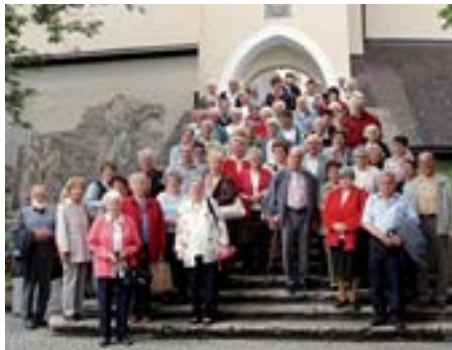
Pilgergruppe vor der Wallfahrtskirche in Rankweil.

Über Feldkirch führen die Pilger nach Rankweil zur Wallfahrtskirche auf dem Liebfrauenberg. Die Basilika, welche auf einem Hügel gelegen ist, bietet eine wunderbare Aussicht auf Rankweil. In dieser Basilika werden seit 500 Jahren Gottesdienste gefeiert und das Gnadenbild von Rankweil aus dem 15. Jahrhundert in der Gnadenkapelle, das silberne Kreuz, oder auch «wundertätiges Kreuz» genannt, im Scheitel des Hauptschiffes und der Stein des hl. Fridolin in der Fridolinskapelle aufbewahrt. Der Legende nach