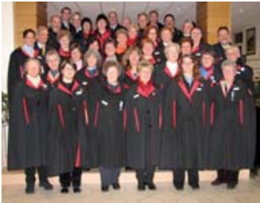
Mitglieder der Krankenpflegevereinigung stellen sich anlässlich der Eröffnungsfeierlichkeiten zum Jubiläumsjahr «150 Jahre Erscheinungen in Lourdes» am 8. Dezember 2007 zum Gruppensfoto.

Gruppe von meinem Geburtstag weiss und ich so nicht so stark an meine Schwester erinnert werde. Doch ich hatte mich geirrt und war sehr überrascht, als am besagten Tag beim Mittagessen das «Happy Birthday» angestimmt wurde. Gerne erinnere ich mich auch an das grossartige und unbeschreibliche Gefühl, als ich an diesem speziellen Tag mit tausenden von Menschen bei strömen-