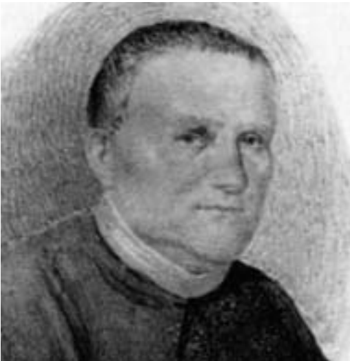
Clemens Maria Hofbauer 1751–1820.