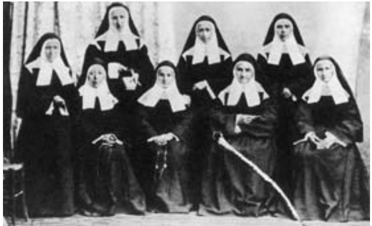
Sr. Marie-Bernard (Bernadette Soubirous vorne in der Mitte) und Mitschwestern von Nevers.

tete die Nonne demütig. – «Aber was sollen wir dann mit Ihnen machen, armes Kind?» – «Wenn Sie wollen, Herr Bischof», warf die Oberin ein, «können wir sie aus Barmherzigkeit im Mutterhaus behalten und im Krankenzimmer irgendwie beschäftigen, und sei es auch nur zum Putzen und zum Kräutertee kochen. Da sie ja immer krank ist, wird das genau das Richtige sein für sie.» Der Bischof war einverstanden und beendete die Debatte erbaulich: «Ich gebe Ihnen die Aufgabe zu beten»,