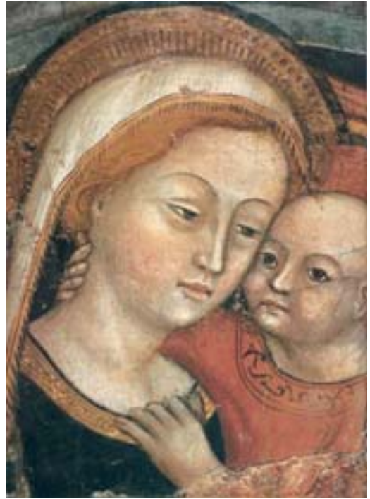
Mutter vom Guten Rat von Genazzano

Maria, durch Deine heilige und unbefleckte Empfängnis reinige mein Herz, meinen Leib und meine Seele im Namen Gottes des Vaters, dessen Tochter Du bist, im Namen Gottes des Sohnes, dessen Mutter Du bist, im Namen Gottes des Heiligen Geistes, dessen Braut Du bist, und im Namen der heiligsten Dreifaltigkeit. O meine schmerzhaftige Mutter, Dir empfehle ich mich durch Dein unbeflecktes Herz. Dich bitte ich, dass Du Dich meiner und aller Sünder erbarmen mögest.